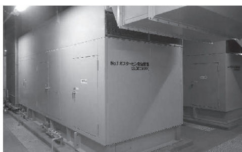
非常用ガスタービン発電装置

住友不動産大崎ガーデンタワーにデュアルフューエル式3000kVA非常用ガスタービン発電装置 2台を納入した。起動は液体燃料（A重油）で行い、負荷への給電とともに都市ガス（13A）に切り替えて運転するシステムである。都市ガスはガス圧縮機で昇圧し、ガスと液体燃料を混合させ十数秒間で徐々に燃料を切り替える。ガス燃料運転は液体燃料専焼型に比べ、ガス圧縮機・アキュムレータ・緊急遮断弁・緊急開放弁・ガス圧縮機制御盤が増えるが、長時間運転できる。また長時間運転を考慮し、運転中に潤滑油を補給できる機構を導入している。近年、事業継続計画（BCP）対応も含め非常用発電装置の長時間運転を希望されるお客様が増えており、本設備は先進性のあるシステムとなっている。