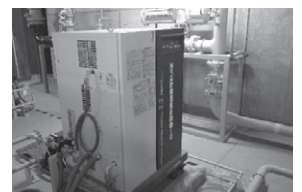
(c) 計器用空気圧縮機